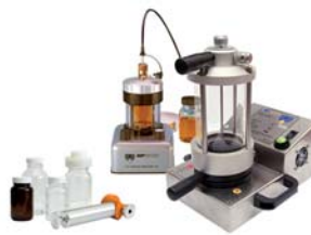
Bottle Sampler BS