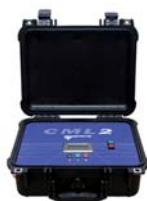
Partikelzähler CML 2