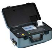
Partikelzähler LPA 2