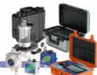
PRODUKTE ZUR KONTAMINATIONS- ÜBERWACHUNG