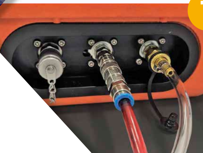
Sauganschluss und Auslass im Betrieb.

Der erste Schritt ist das einfache Anschließen des CML4 an einen Minimesstestpunkt (Druckbereich 2-420 bar) oder den Tank der Maschine (drucklos). Das CML4 ist mit einer eingebauten Pumpe ausgestattet, welche die Analyse von Fluiden in drucklosen Systemen ermöglicht. Zum Schutz der Umwelt gewährleisten Standard-Hydraulikanschlüsse eine schnelle und sichere Anbindung.